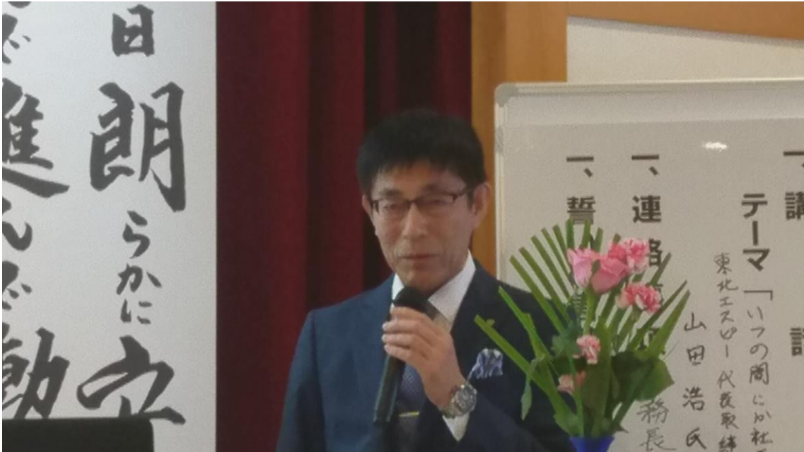
講和の内容を整理してお話しをされる